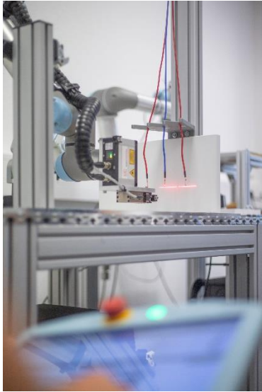
Bild 1: Um den exakten Abgreifpunkt zu ermitteln, verarbeitet ArtiMinds RPS die Scan-Ergebnisse in Echtzeit und synchronisiert es mit der Roboterbewegung