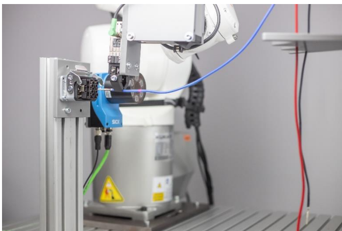
Bild 3: Dank intelligenter Funktionsbausteine und Kraftregelung kann der Roboter auch flexible Leitungen und Kabel robust und sicher in ein Steckergehäuse einstecken