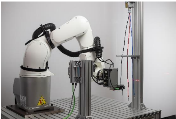
Bild 2: Freihängende Kabel, die sich in alle Richtungen verwinden können, lassen sich mittels Laserscanner treffsicher detektieren und picken; Quelle: ArtiMinds Robotics GmbH