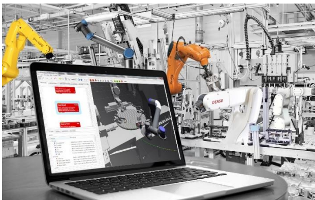
Bild 3: Mit ihrem Template-basierten Low-Code-Ansatz unterstützen ArtiMinds RPS und LAR die Roboter und Peripheriegeräte aller namhafter Hersteller