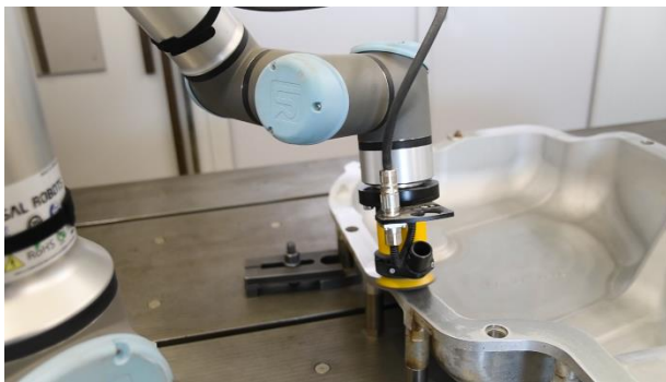
Bild 2: Mit dem CAD2Path-Feature können Werkzeugpfade für komplexe Konturen wie bei Formschalen auf Basis von CAD-Modellen automatisiert erstellt werden